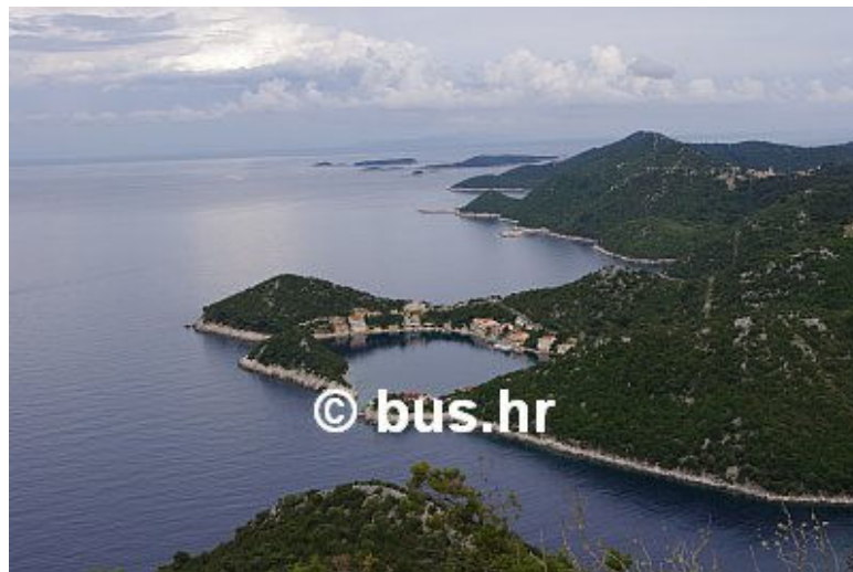
Skrivena Luka na otoku Lastovu