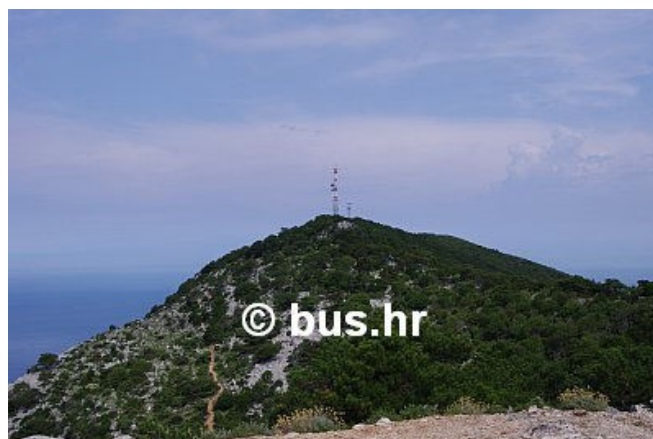
Televrin – najviši vrh otoka Lošinja